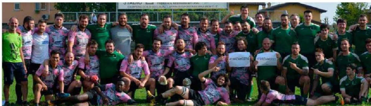
Il gruppo dei ragazzi del Rugby Chiese e Crema